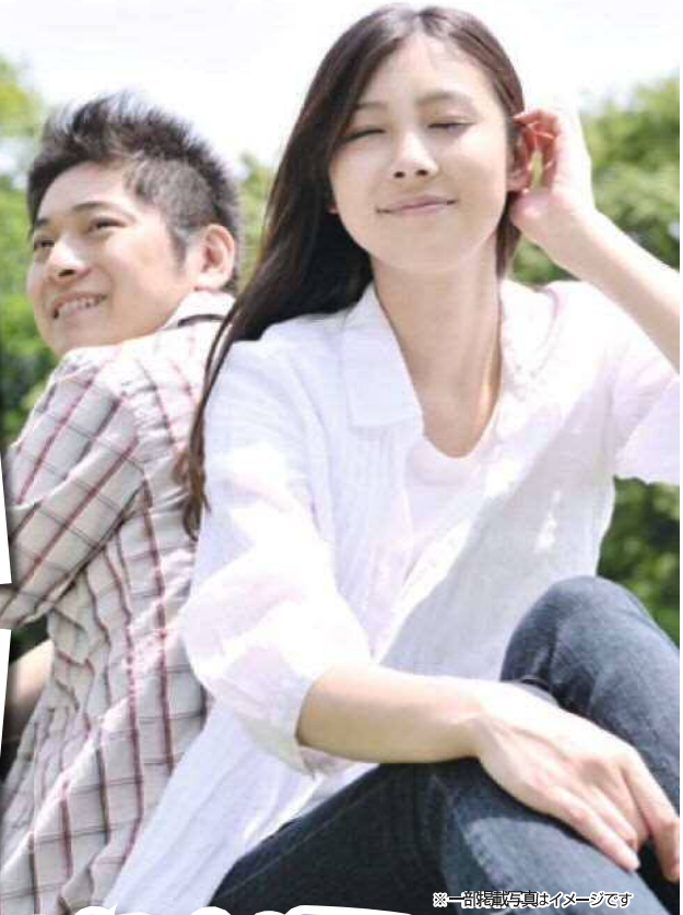
※一部掲載写真はイメージです