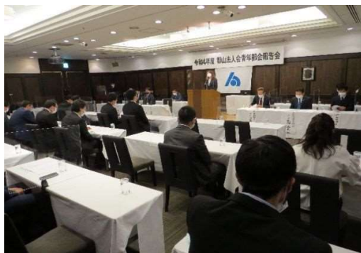
○報告会 (R4. 5. 27) ・令和3年度事業経過、収支予算及び令和4年度事業計画、収支予算について報告した。