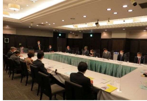
○厚生委員会 (R4. 8. 4)