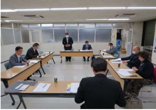
○組織委員会 (R4. 10. 11/R5. 3. 13)