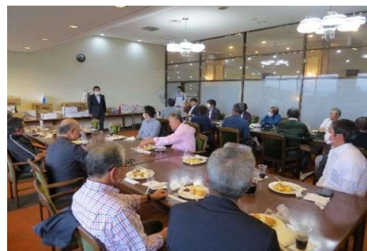
○親睦ゴルフコンペ (R4. 10. 6)

・未婚化・晩婚化による少子化対策、地域社会発展のため、独身男女の出会いの場を提供するイベント開催。これまでに19回開催し、延べ93組のカップルが成立した。