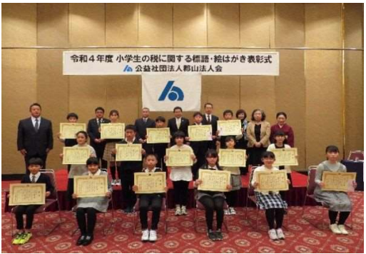
○表彰式 (R4. 11. 15)