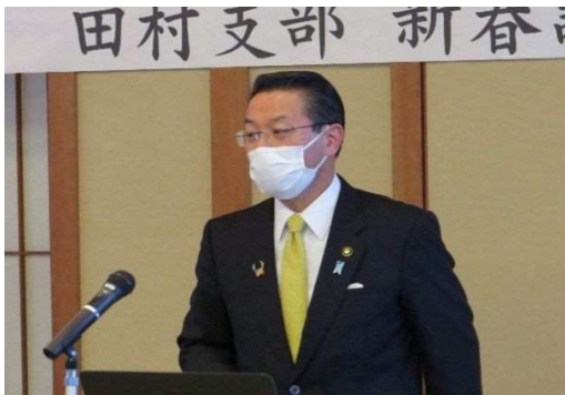
○田村支部新春研修会 (R5. 2. 28) ・田村市政等について、白石高司市長にご講演いただいた。