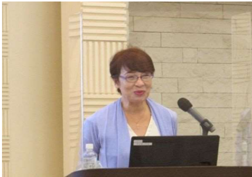
○新春講演会・新春賀詞交歓会 (R5. 2. 1)

・ベストセラー「妻のトリセツ」でお馴染みの黒川伊保子氏を迎え、「感性コミュニケーション ～男女脳差理解による組織力アップ～」と題し、講演いただいた。また、情報交換、会員交流を目的とした新春賀詞交歓会を合わせて開催した。