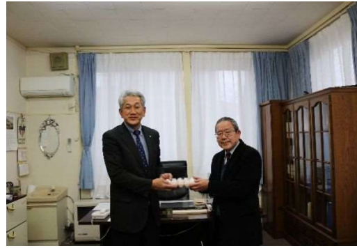
○小野町献血運動へたまご寄贈 (R5. 1. 27) ・社会貢献活動の一環で、小野町で実施している献血運動にご協力いただいた方へ、お礼として配布するためのたまごを、小野町へ寄贈した。