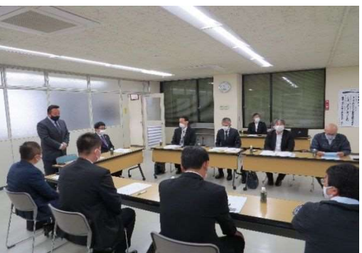
○税に関する標語の審査会 (R4. 10. 12) ・小学生の税に関する標語に応募のあった274作品から10点を選出し、表彰した。