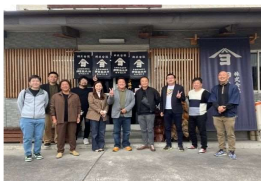
○視察研修会 (R4. 10. 13) ・会員親睦・交流を図るため、茨城方面へ視察研修会開催。押田製材所、竜神大吊橋等を見学した。