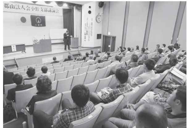
熱心に聞き入る聴講者