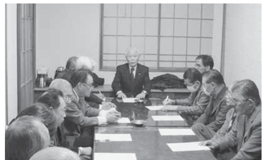
大越地区会員研修会

講演終了後の懇談会では、市長との意見交換や、会員相互の情報交換を通じ、交流を深めていた。