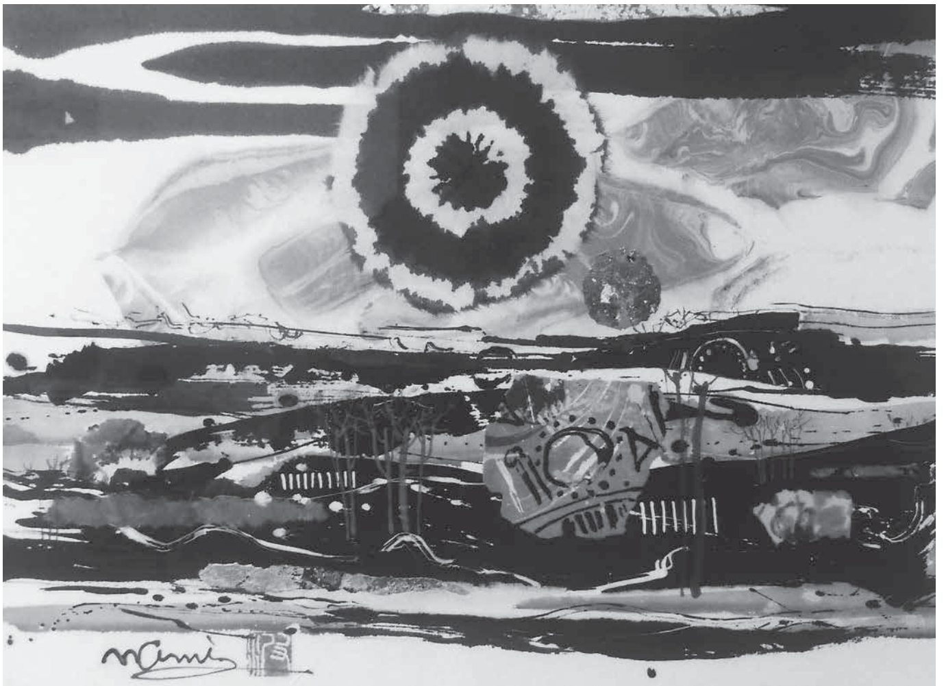
題名/夕陽の里 提供/大波 天久 中国書法研究院客員教授・郡山法人会副会長