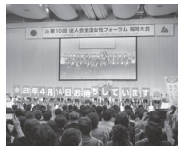
全国女性フォーラム「福岡大会」に参加