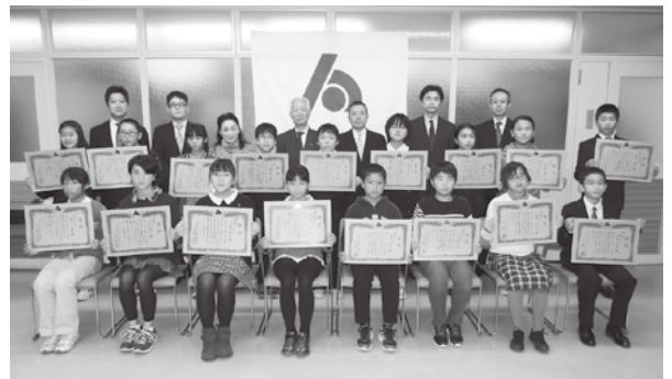
税に関するコンクール受彰者