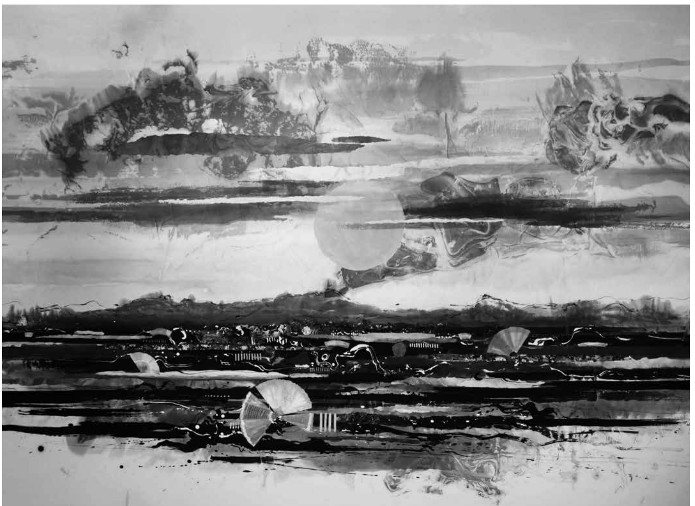
題名/集落に陽が沈む