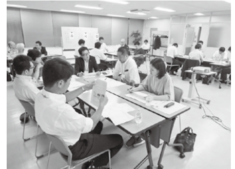
ディスカッションする参加者