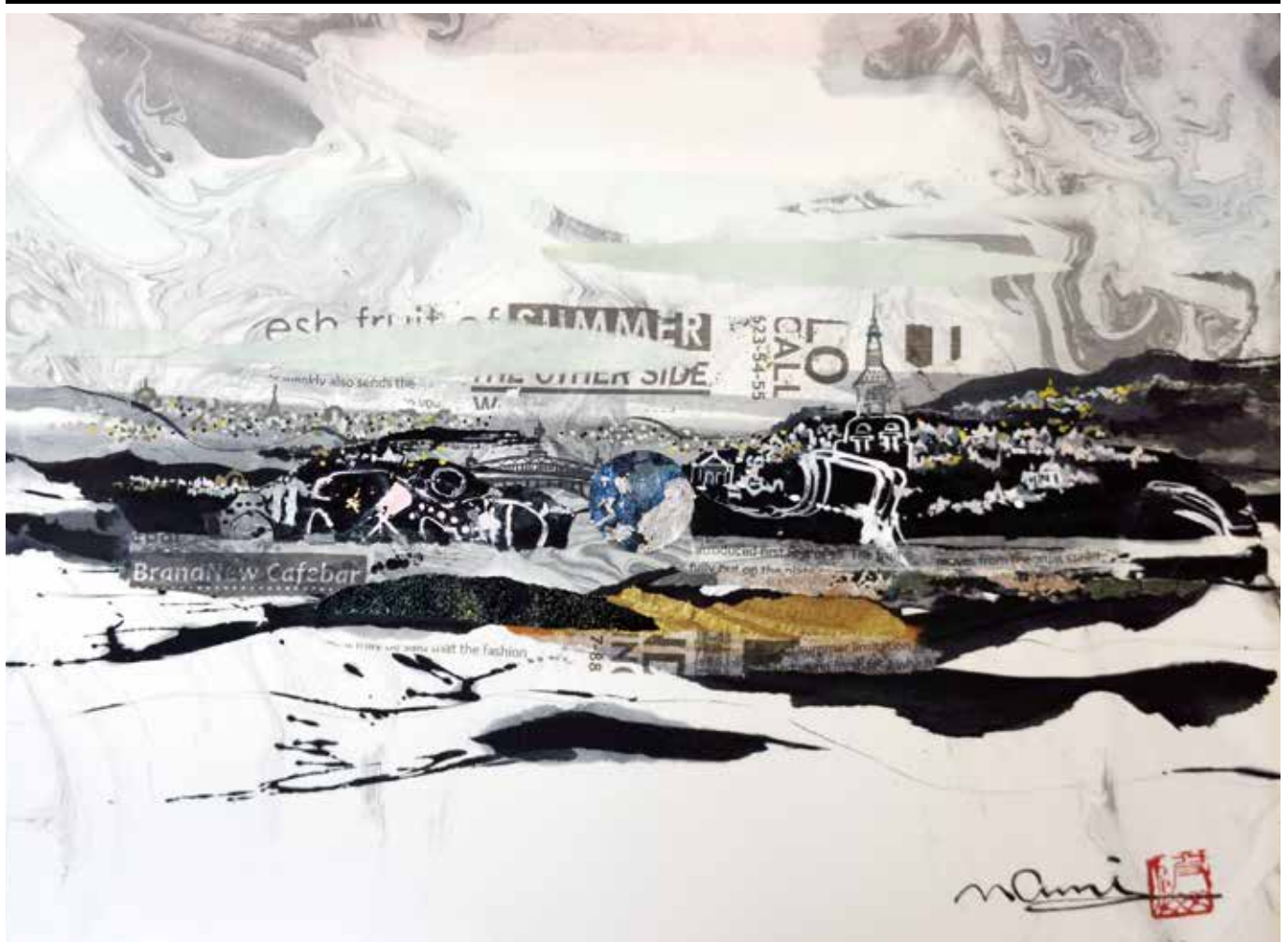
題名/セーヌ川のほとり(F8号) 提供/大波 天久 中国書法研究院客員教授