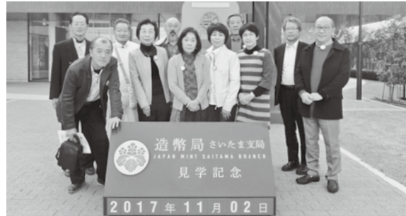
小野支部 造幣局さいたま支局前