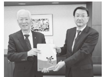
菊地署長(右)にクリアファイルを手渡す伊野会長

11月6日、税の啓発、租税教育の一環として、郡山税務署においてクリアファイル贈呈式を行った。当日、法人会キャラクター・けんたくんがデザインされたクリアファイル1,050部を菊地荘助署長に手渡した。税に関する作文に応募いただいた中学生および高校生全員に応募記念品として配付されます。