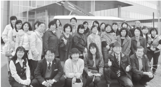
三春支部 グリコピア・イースト前