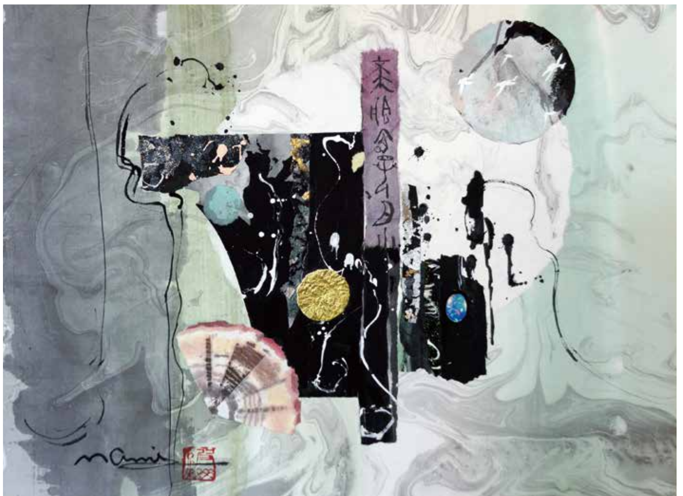
題名/今も残る思い出の屋敷(F6号) 提供/大波 天久 中国書法研究院客員教授