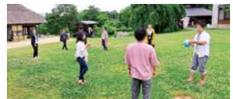
キャッチボールを楽しむ参加者