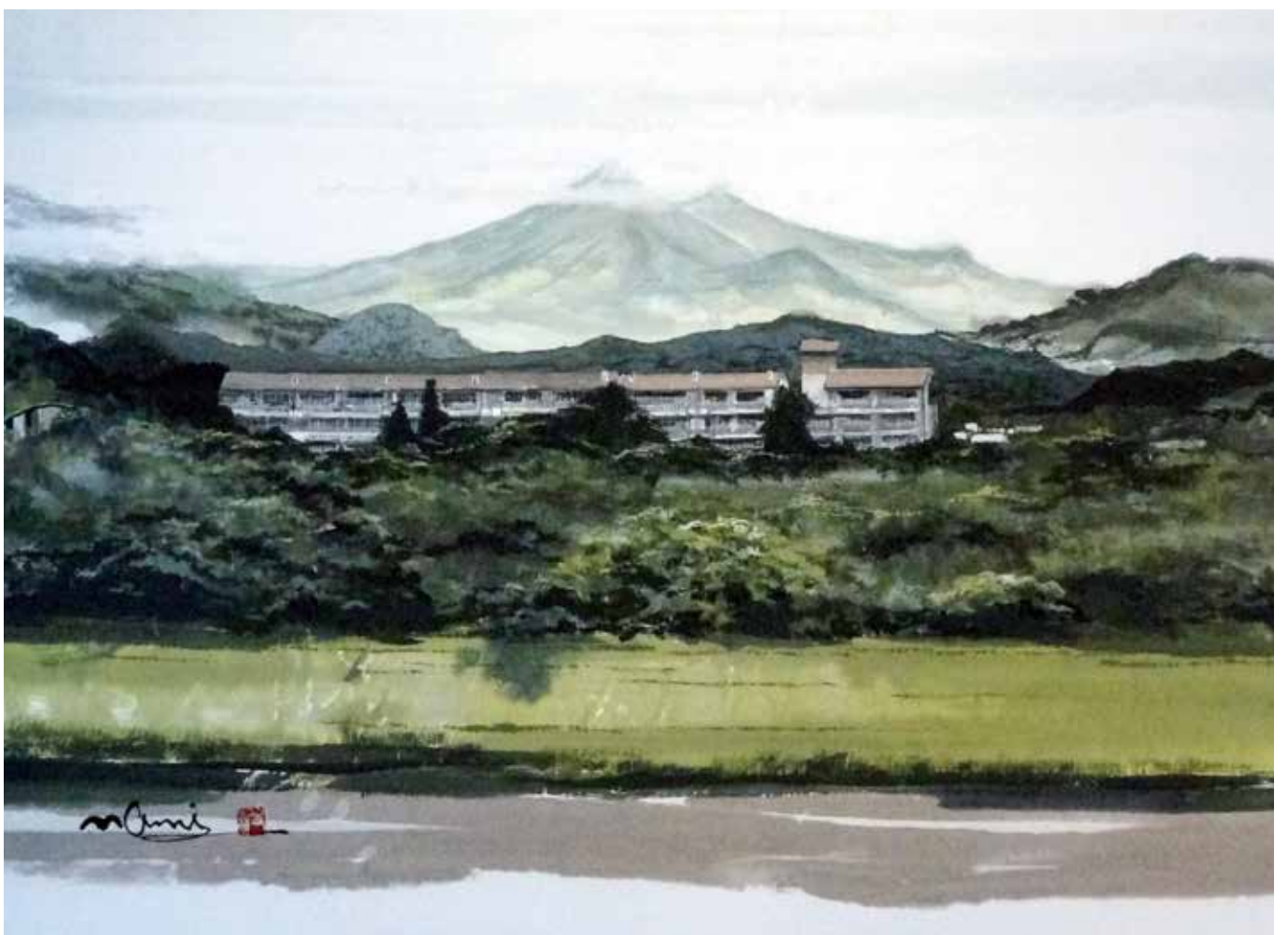
題名／喜久田中学校新緑の校舎(30号) 提供／大波 天久 中国書法研究院客員教授