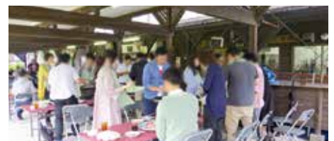
グループに分かれバーベキュー

また、このたび、これまでの婚活事業で誕生したカップル2組がご結婚にいたった旨の報告がございましたのでお知らせいたします。おめでとうございます。