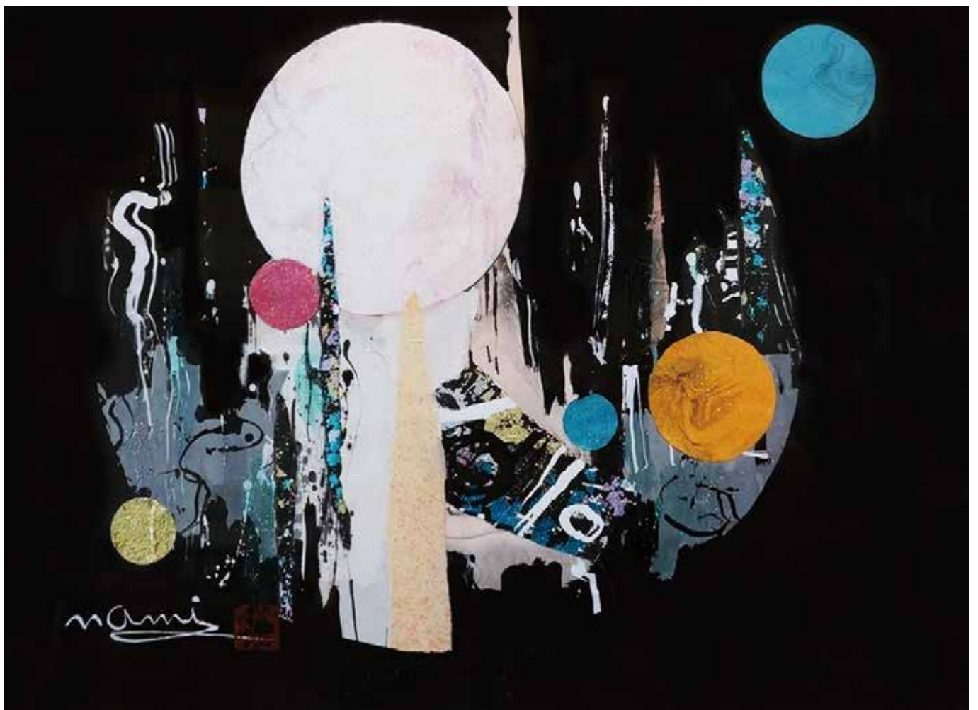
題名/夢想の月(8号) 提供/大波 天久 JIAS日本国際美術家協会会員