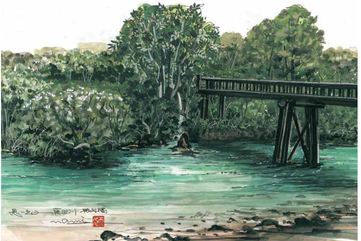
題名/木造の橋(6号) 提供/大波 天久 JIAS日本国際美術家協会会員