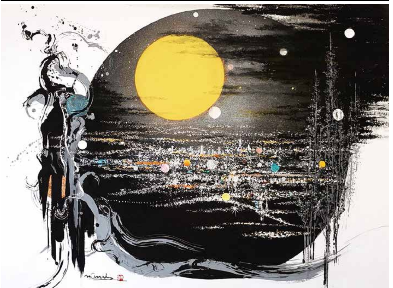
題名/夕陽輝く街明り(50号) 提供/大波 天久 JIAS日本国際美術家協会会員