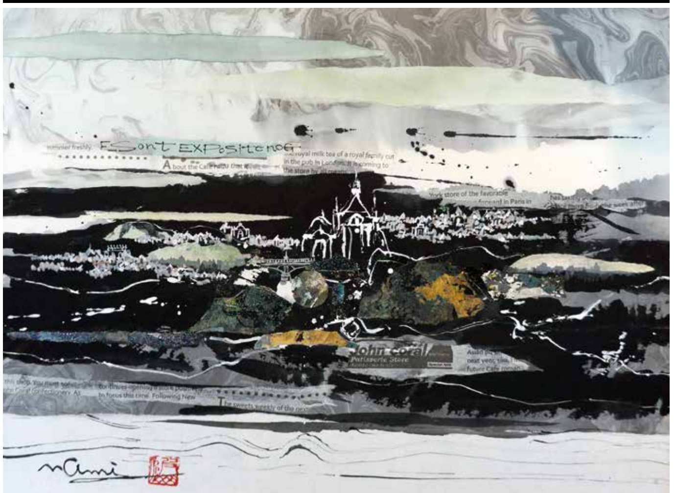
題名/ノートルダム(20号) 提供/大波 天久 JIAS日本国際美術家協会会員