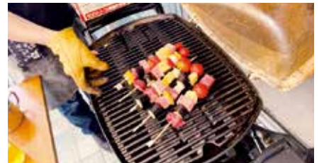
串づくり体験で作った串焼き