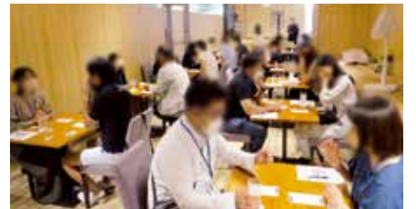
積極的にアピールする参加者

最後に、お互い名前が書いてあればカップル成立のマッチングタイムと、男性から女性へ直接告白する「告白タイム」を行い、合計3組のカップルが誕生した。