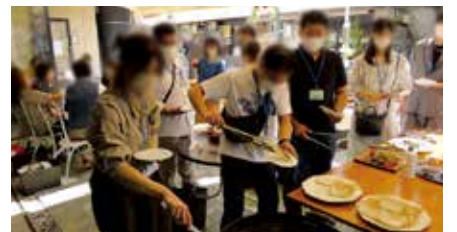
バーンストライプコンテスト (誰が一番キレイに食パンに焼き目をつけられるか)