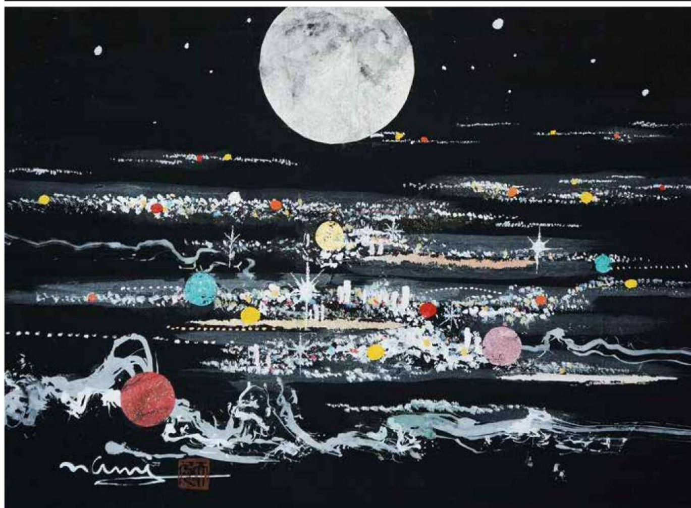
題名／輝く街明かり 提供／大波 天久 JIAS日本国際美術家協会会員